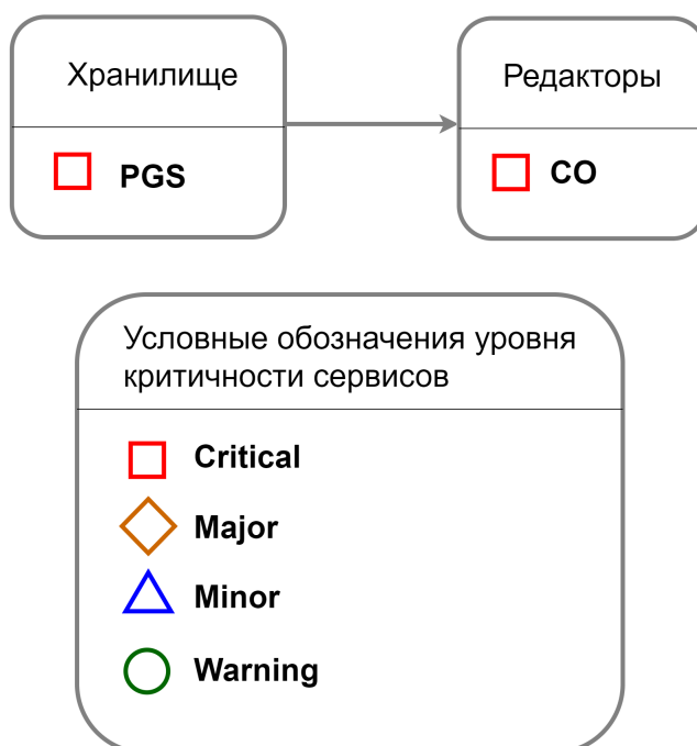
Рисунок 1 – Сервисно-ресурсная модель МойОфис Частное Облако